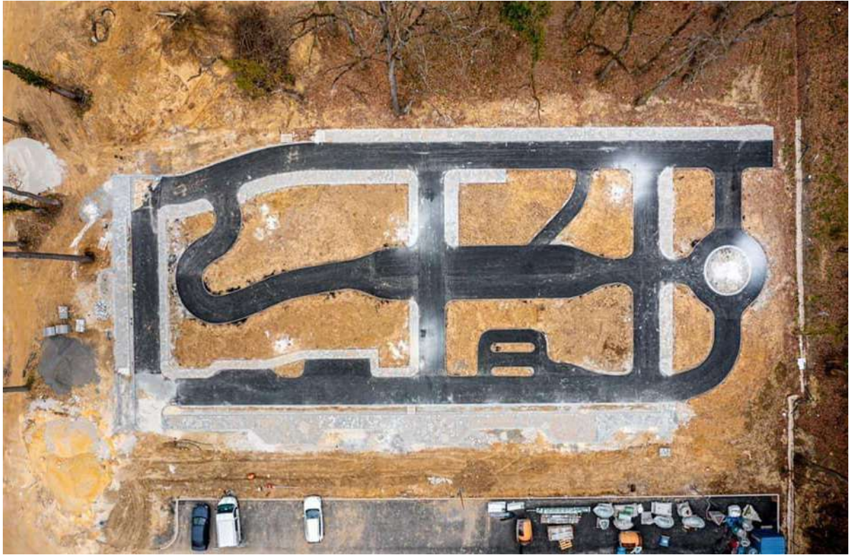
kreszpark (Alsóerdei Sport és Élmenypark)