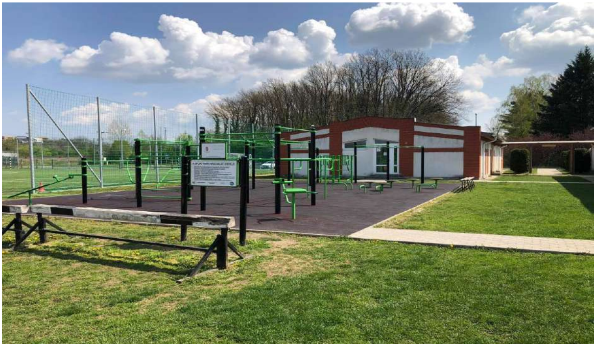
Ifjúsági és Sportcentrum