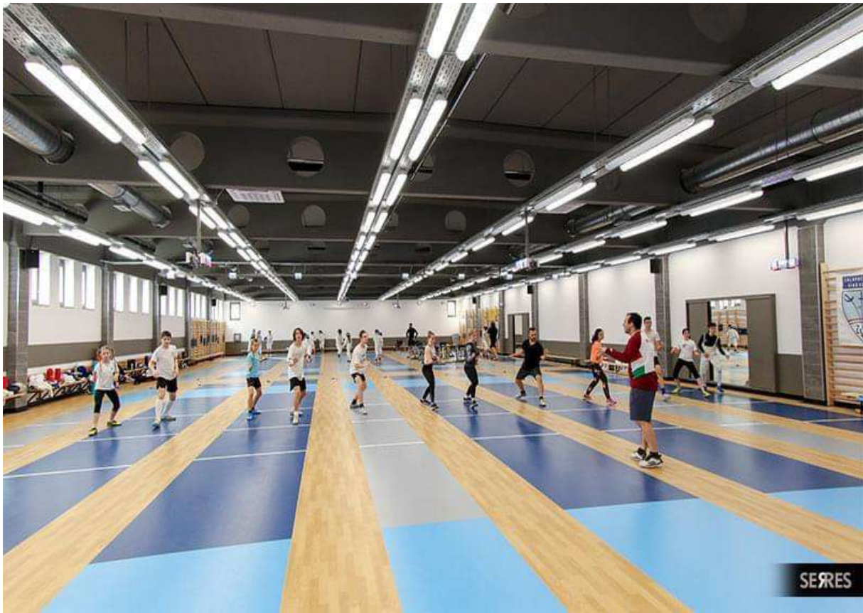
Mindszenty Sportközpont tornacsarnokkal és vívócsarnokkal