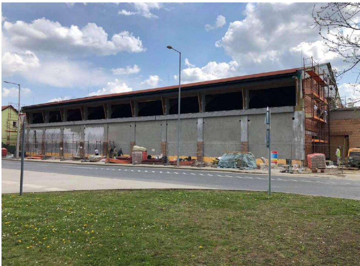
Dózsa iskola tornaterem