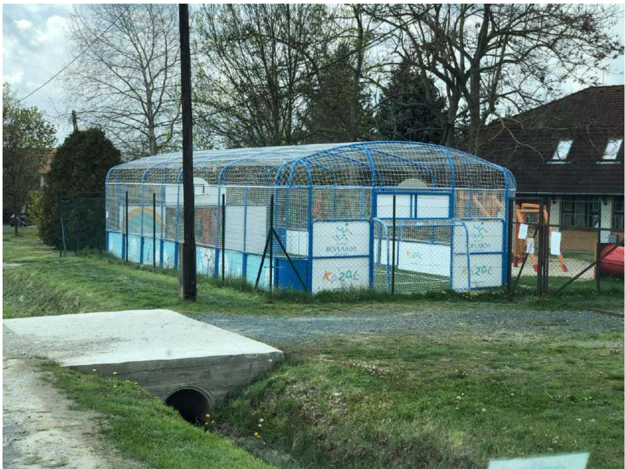
2 ovi sport pálya a 13-ból (Kodály Tagóvoda és Szivárvány téri Tagóvoda)