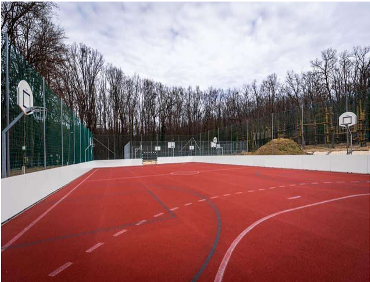
sportpályák (Alsóerdei Sport- és Élmenypark)