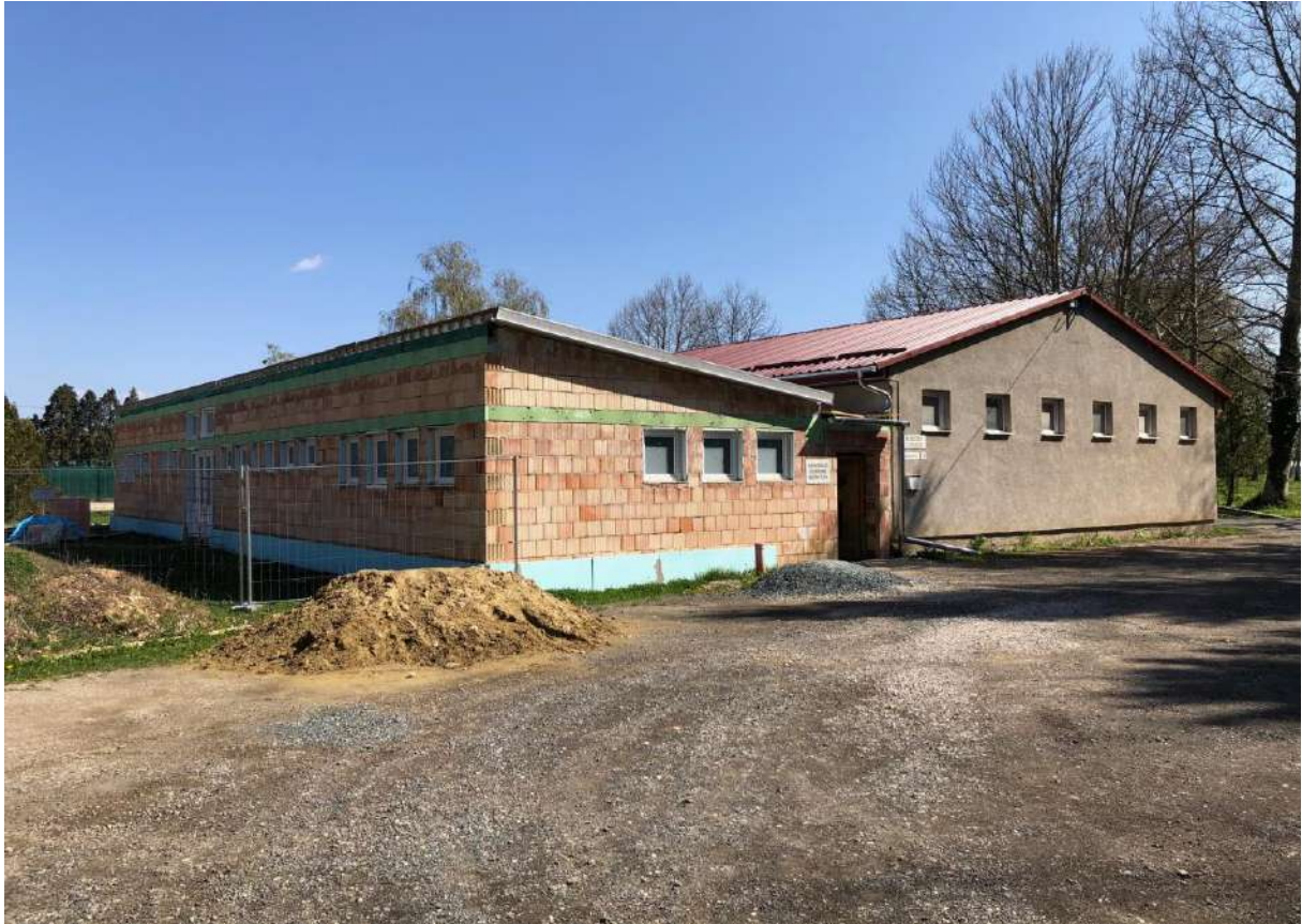
a birkózócsarnok felújítása, bővítése