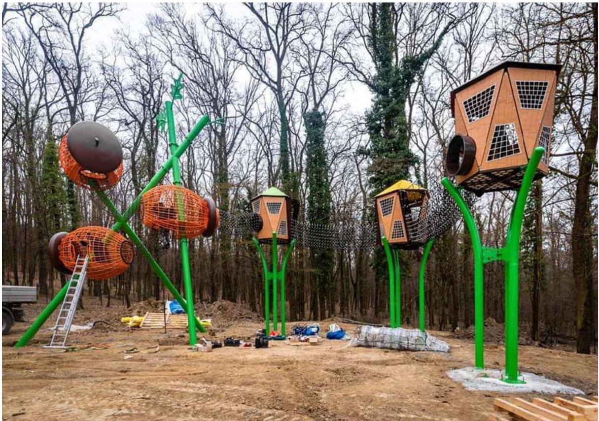
erdei kalandpark (Alsóerdei Sport- és Élménypark)