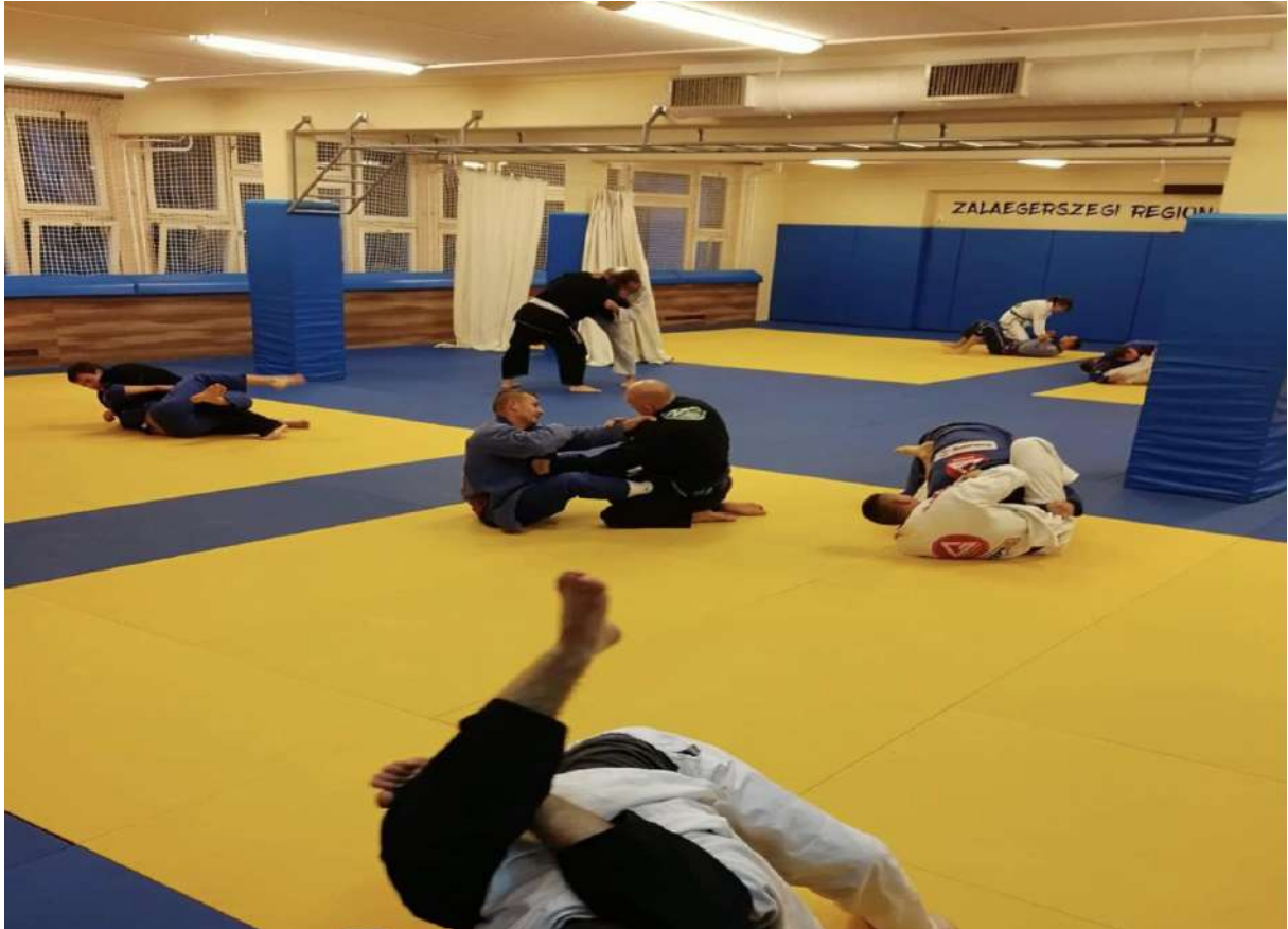
Regionális Judó Központ (Apáczai VMK)