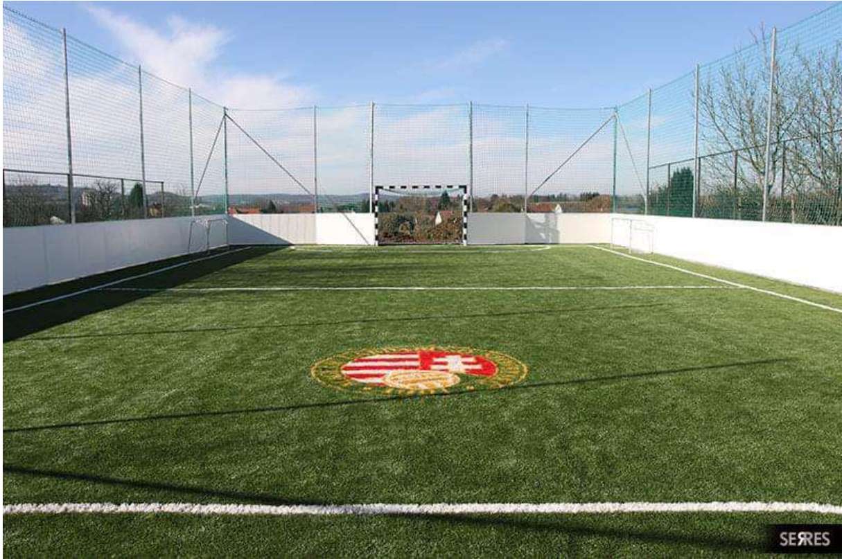
műfüves grundpálya (Neszele)