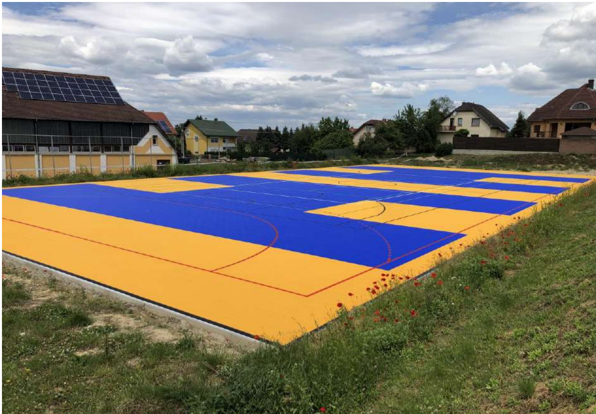
Szivárvány téri multifunkcionális sportpálya (Csács)