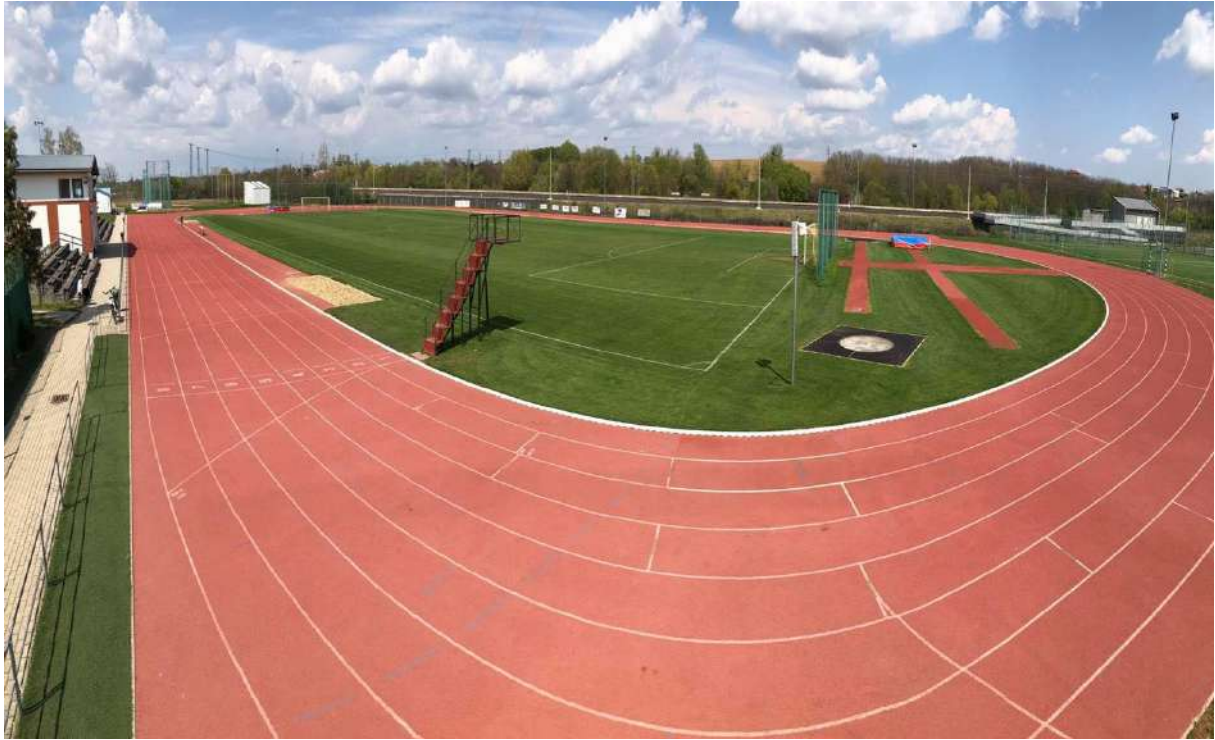
Ifjúsági és Sportcentrum