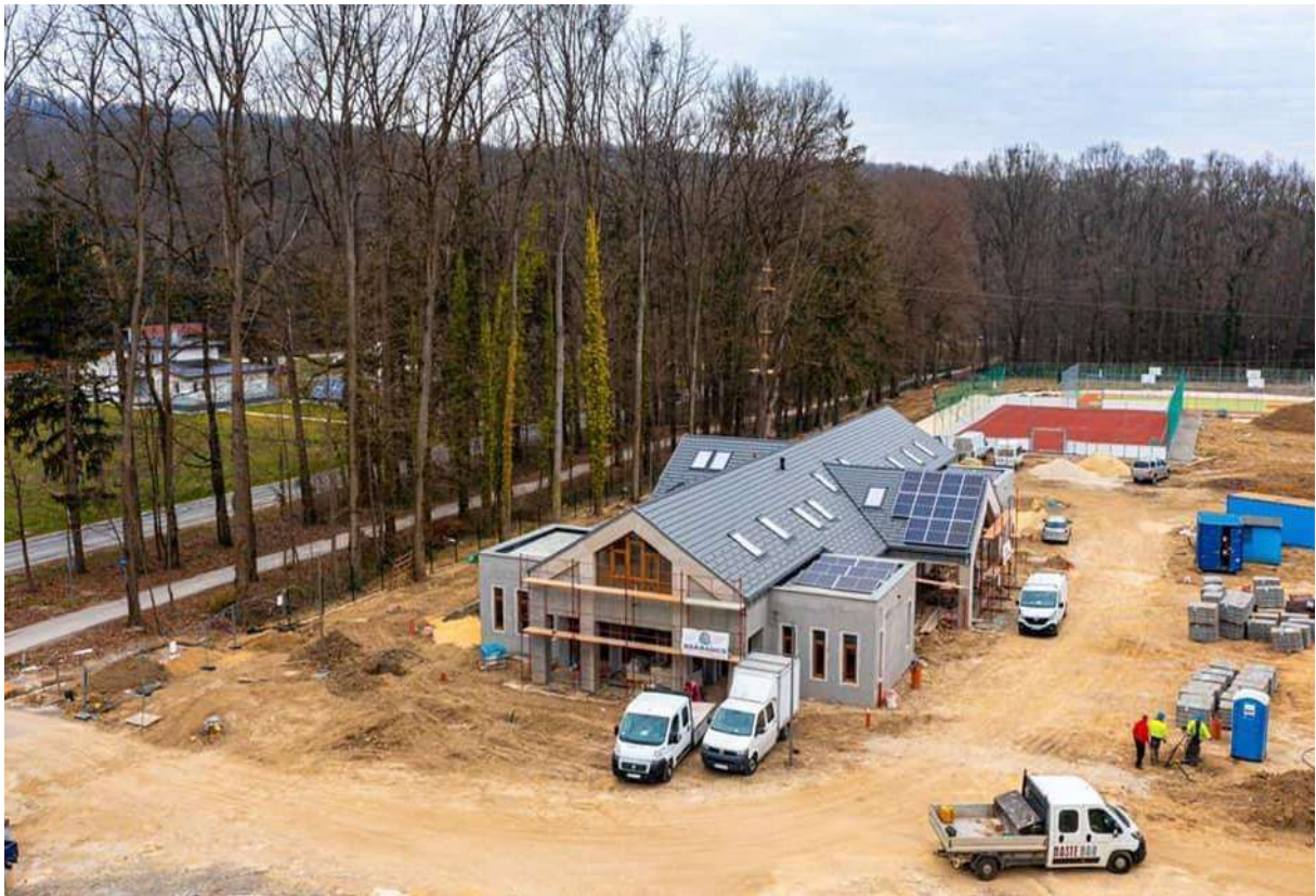
Alsóerdei Sport- és Élmenypark