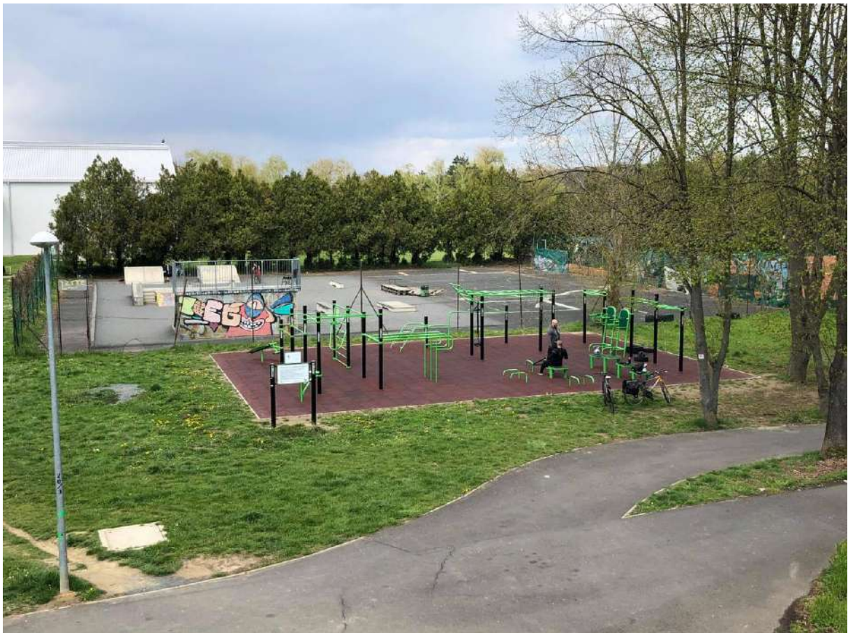
sportpark és gördeszka pálya a Sportcsarnoknál