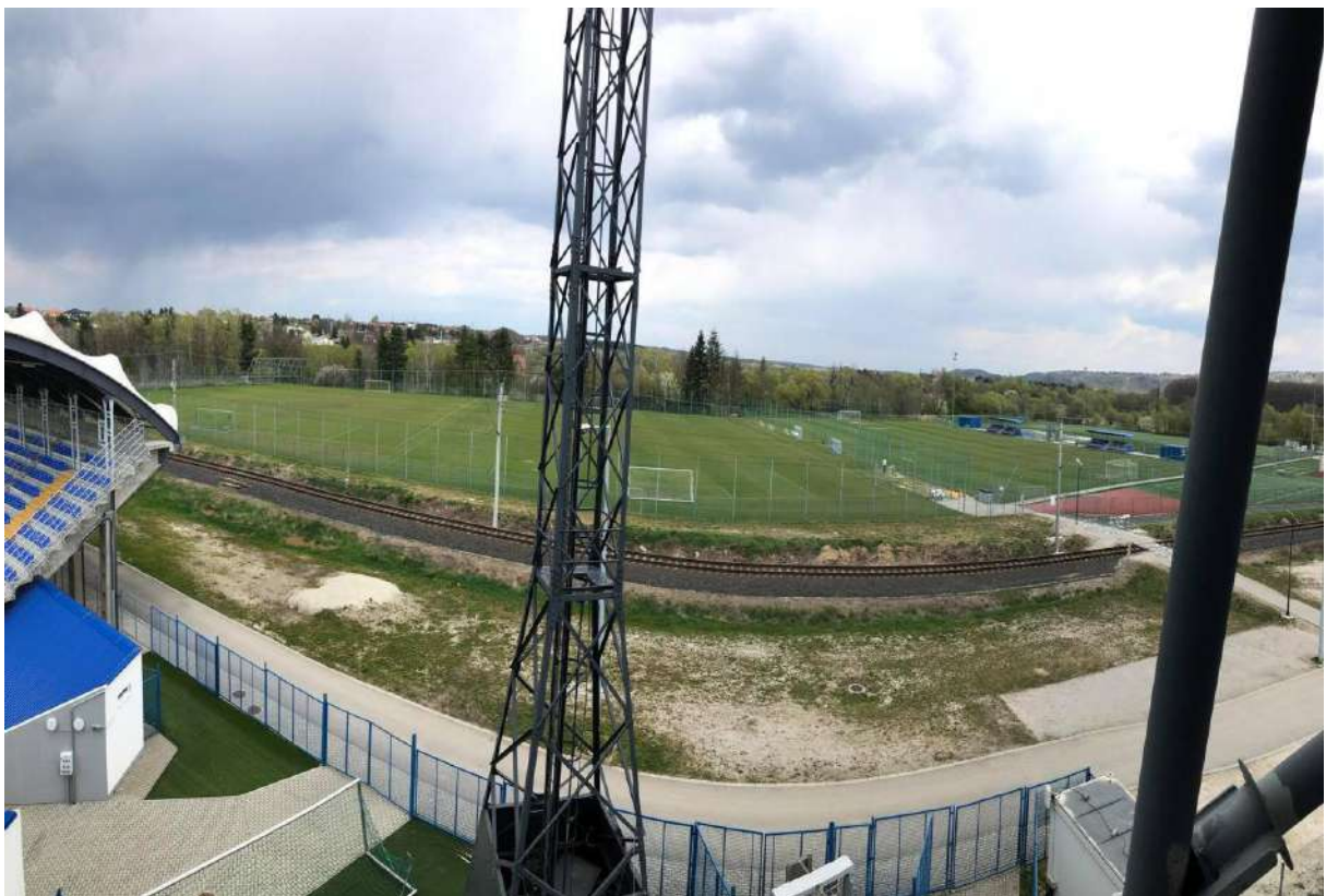
Stadion mögötti edzőpályák és futódomb