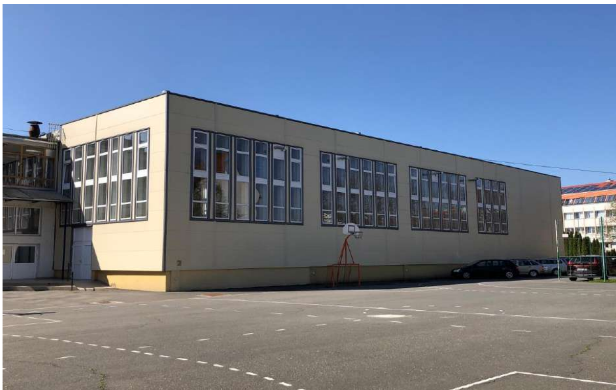
Ady iskola tornaterem