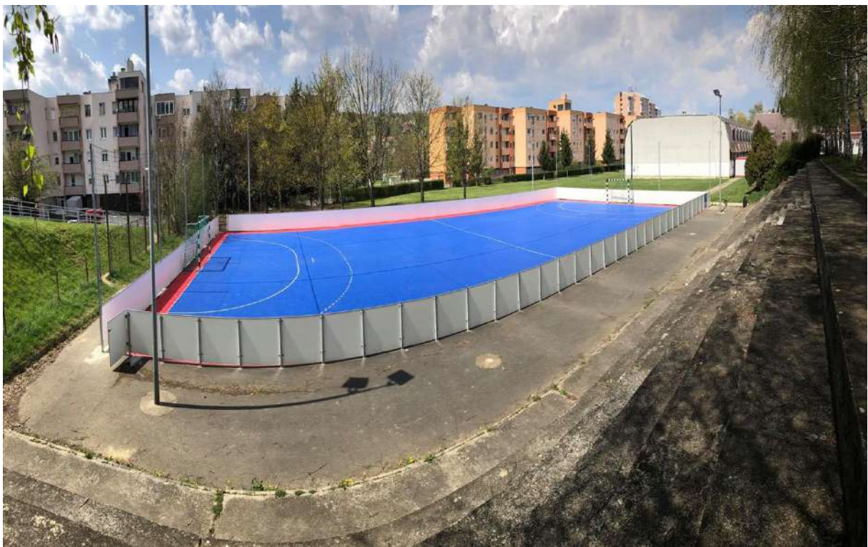
kézilabda pálya (Apáczai VMK)