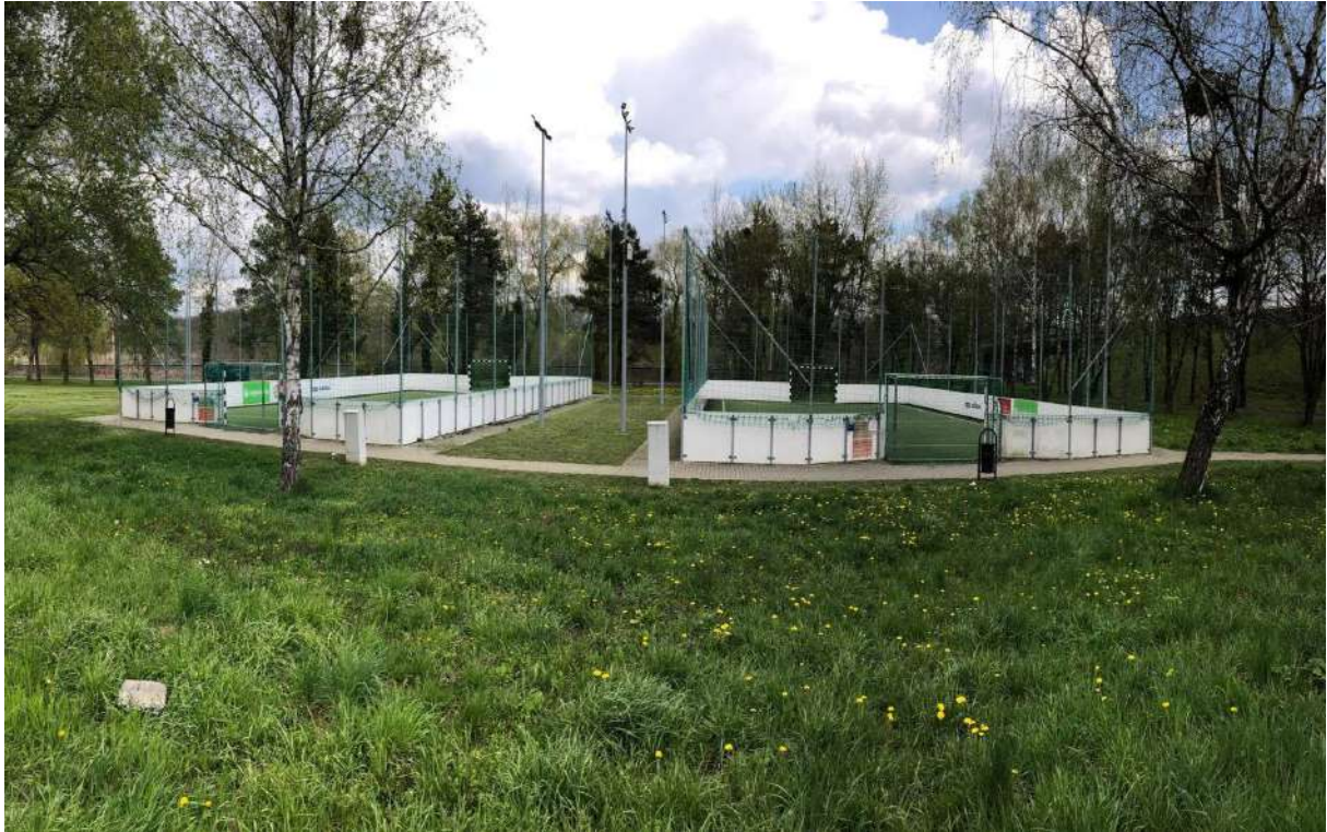
műfüves grundpályák a Sportcsarnoknál