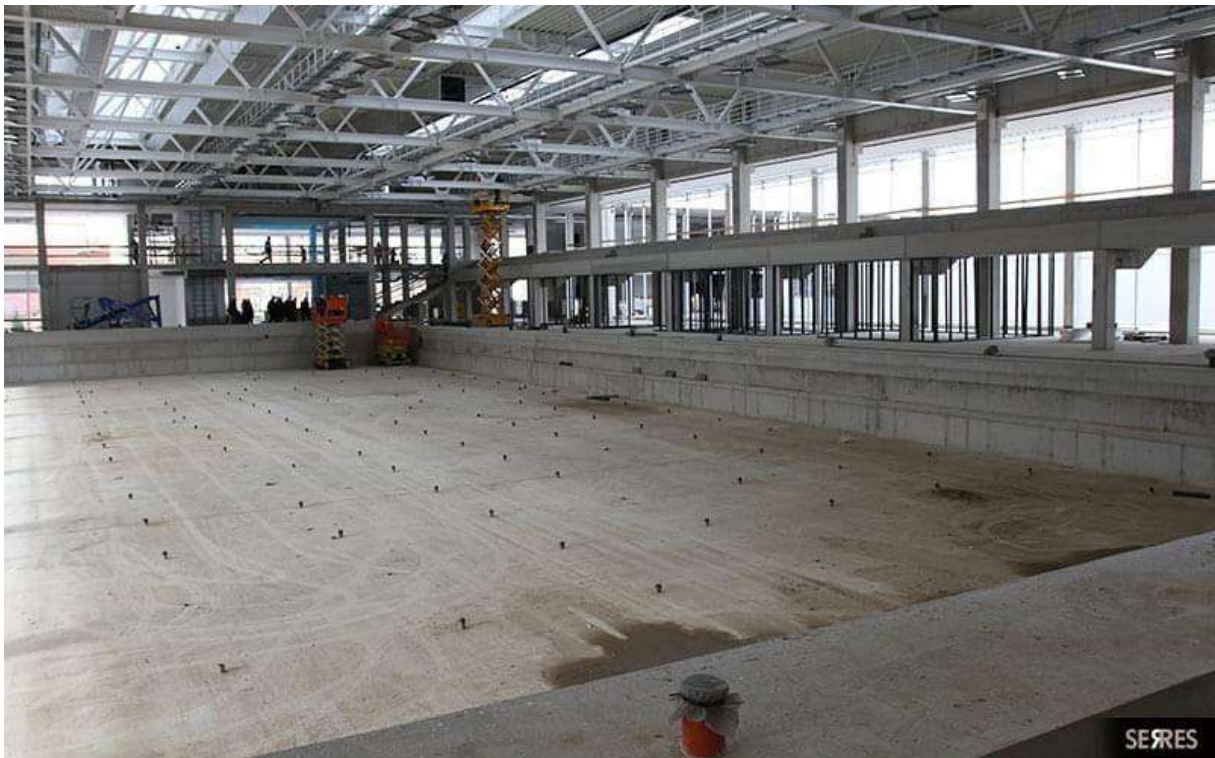
Épül az új fedett uszoda