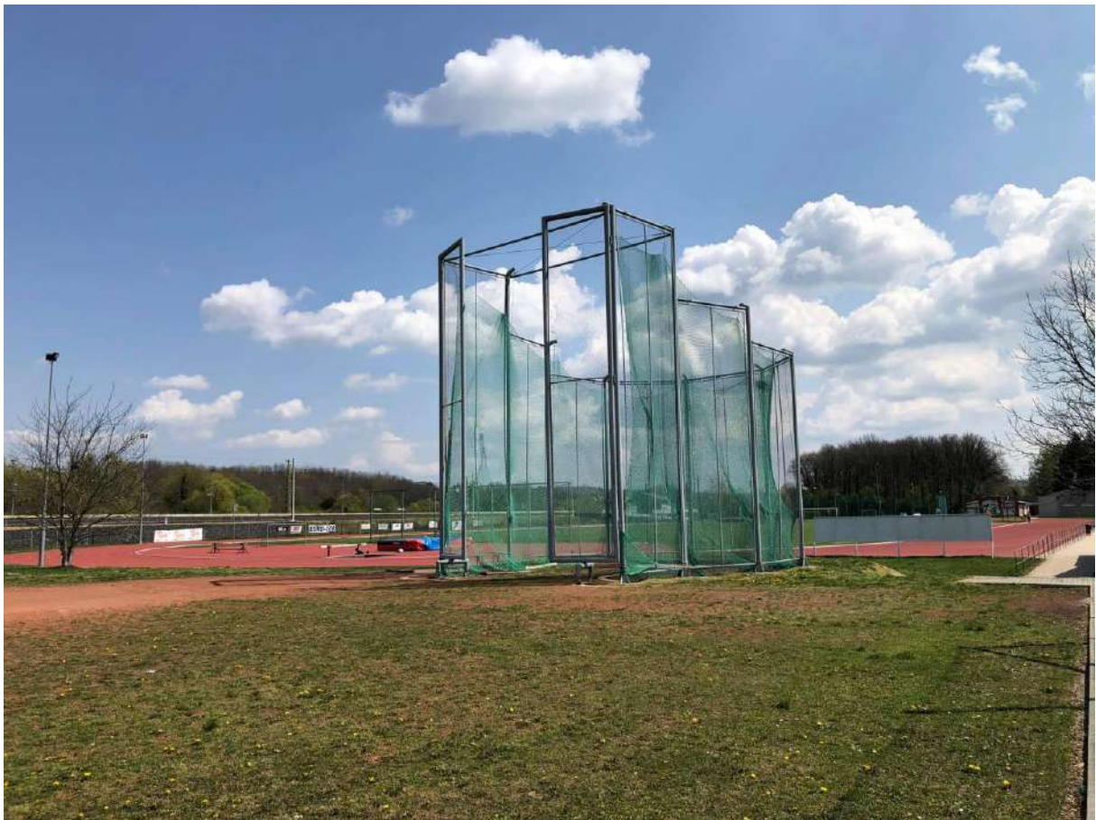
Ifjúsági és Sportcentrum