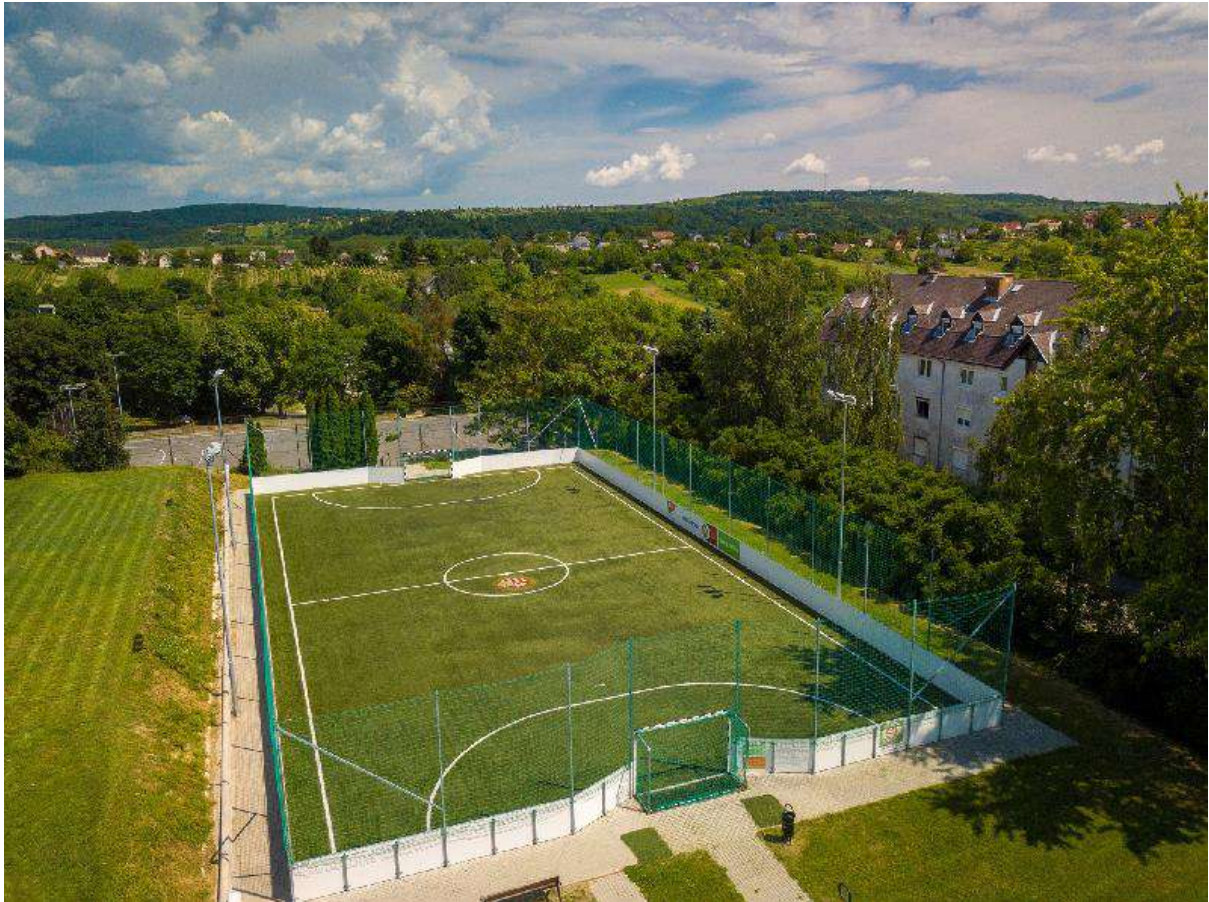
műfüves pálya (Páterdomb)