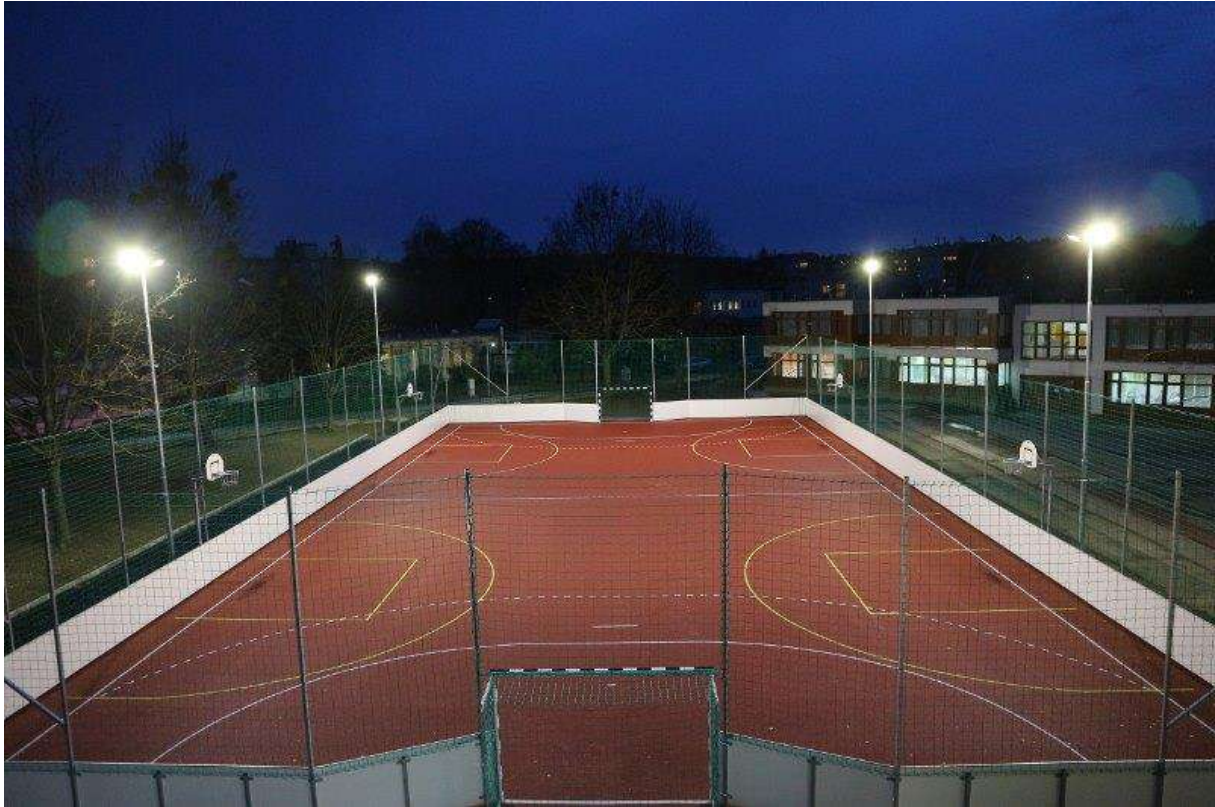
20x40-es rekortán pálya (Eötvös Iskola)