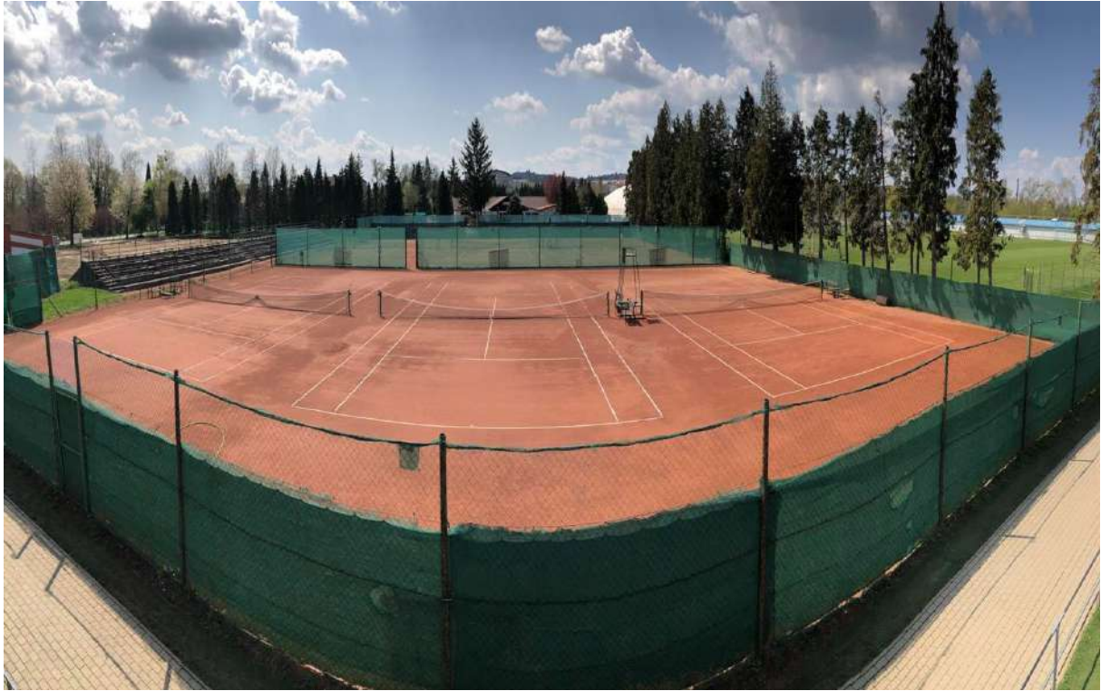
Ifjúsági és Sportcentrum