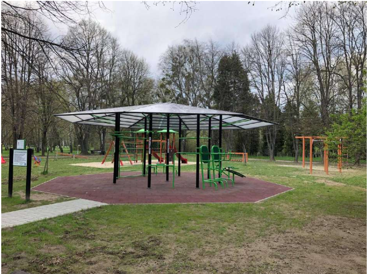
Street Workout park (Parkerdő)