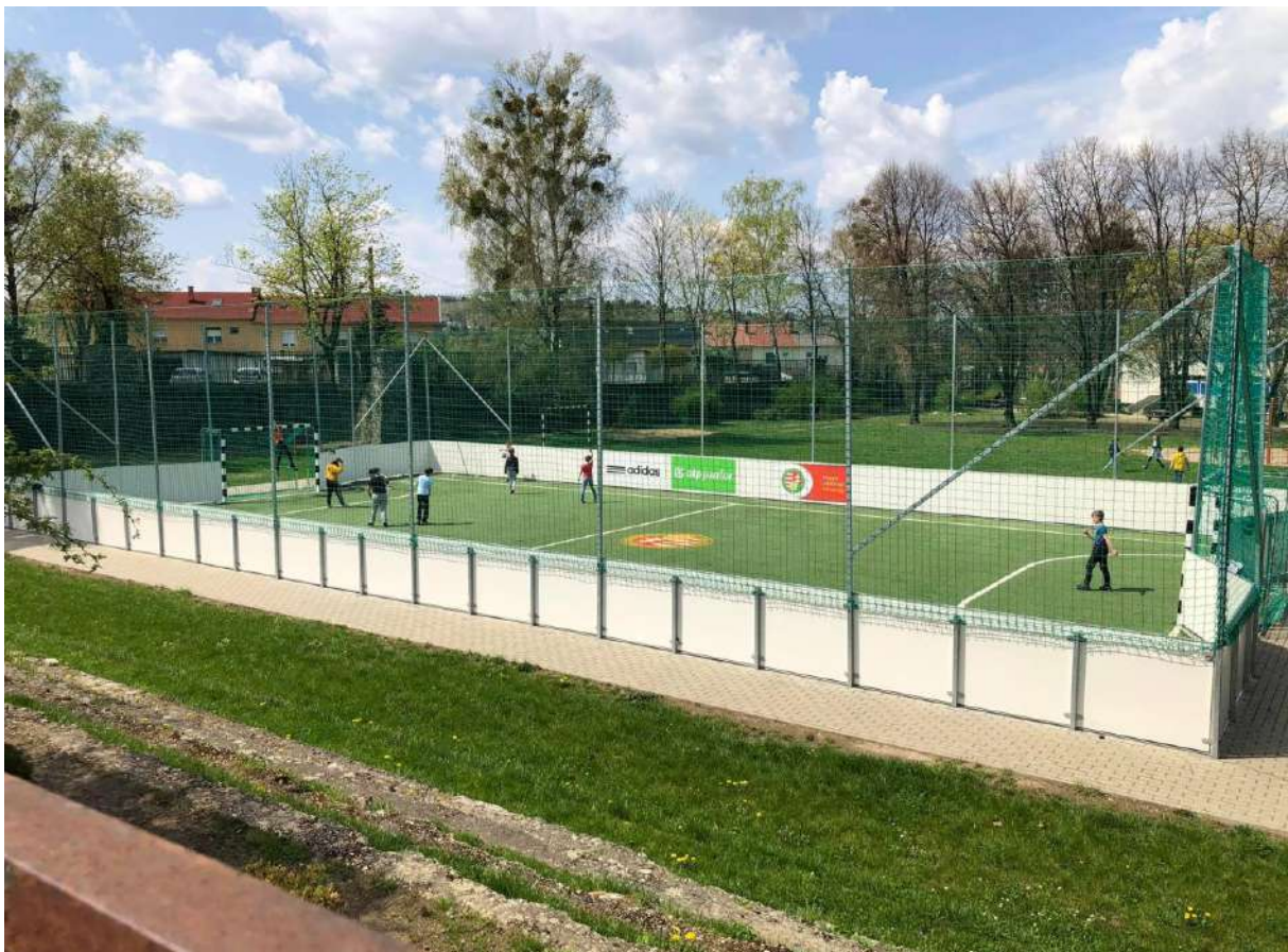
műfüves grundpálya (Liszt Iskola)