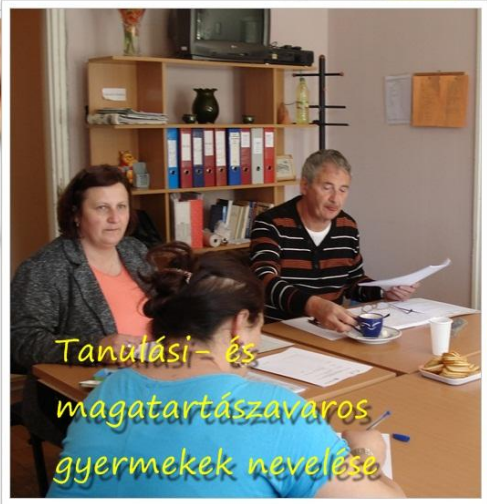
Tanulási- és magatartászavaros gyermek nevelése