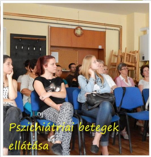
Pszichiátriai betegek ellátása