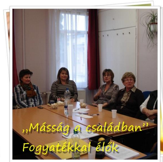
„Másság a családban” Fogyatékkal élők