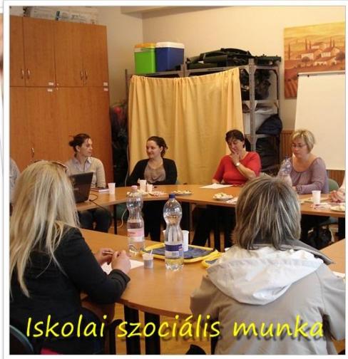
Iskolai szociális munka