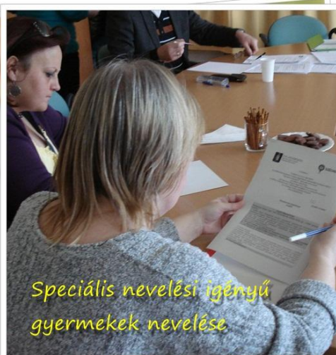
Speciális nevelési igényű gyermek nevelése