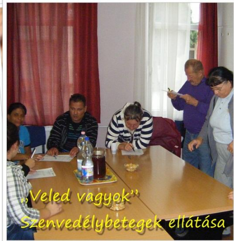
„Veled vagyok” Szenvedélybetegek ellátása