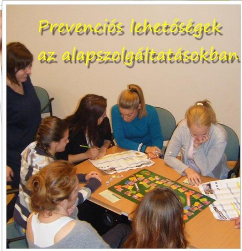
Prevenációs lehetőségek az alapszolgáltatásokban