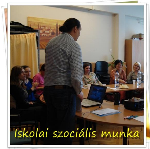
Iskolai szociális munka