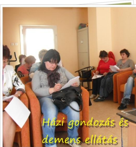
Házi gondozás és demens ellátás

TÁMOP-5.4.9-11/1-2012-0043 Modellkísérleti program az alapszolgáltatások funkcionális összekapcsolására "Egymásra hangolva" című pályázati projekt