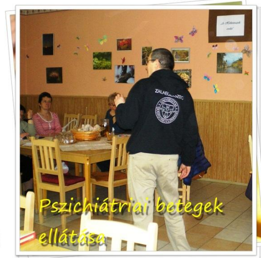
Pszichiátriai betegek ellátása